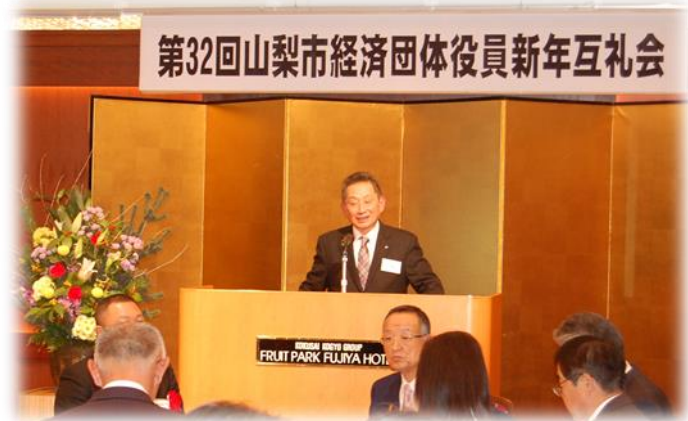
【第32回山梨市経済団体役員新年互例会 平成31年1月11日】

このような中、商工会は皆様の経営の持続的発展に寄与し、今まで以上に会員に寄り添った伴走型支援を強化し、「信頼され、役立つ商工会」を目指し役職員一丸となり邁進して参る所存です。